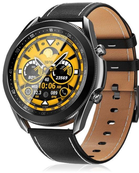
Smartwatch - W3 - AF0067