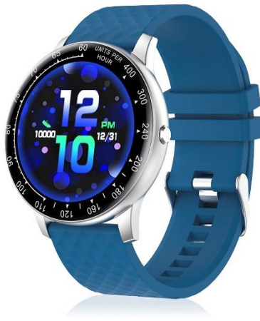
Smartwatch DMAD0064 - H30