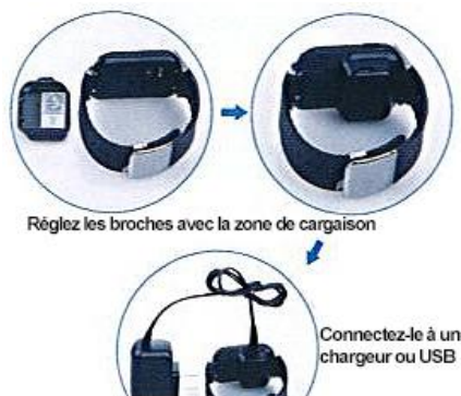
Diagramme de charge:

Bouton d'accueil: pour activer / désactiver l'horloge (maintenir la touche enfoncée), tourner l'écran de mode veille et en dehors, revenir au menu de départ.