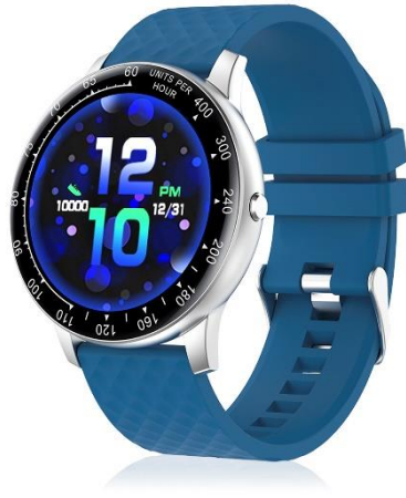
Smartwatch DMAD0064 - H30